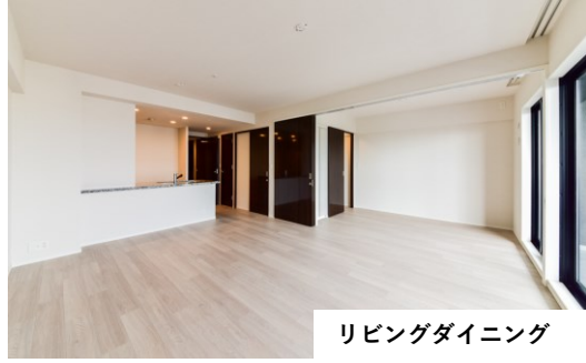
リビングダイニング